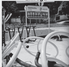
6 Academias da Terceira Idade (ATI) Totalizando 13 academias em Ibiporã