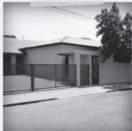
Centro de Convivência dos Idosos (CCI) Abílio de Paula Barros