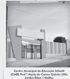
Centro Municipal de Educação Infantil (CMEI) Prof.ª Maria do Carmo Galvão Uille Jardim Eden / Malibu