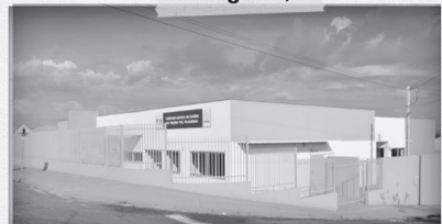
Unidade Básica De Saúde (UBS) Dr. Mauro Feu Filgueiras - Jardim San Rafael