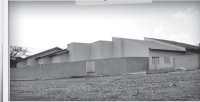
Centro Municipal de Educação Infantil (CMEI) Jardim Santa Paula