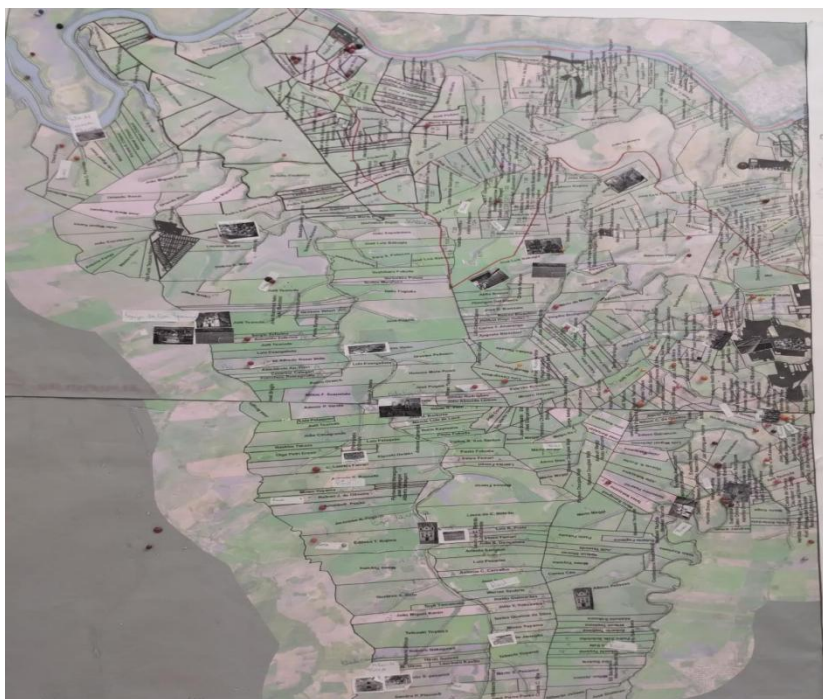
Figura 4 Mapa da área da Taquara do Reino