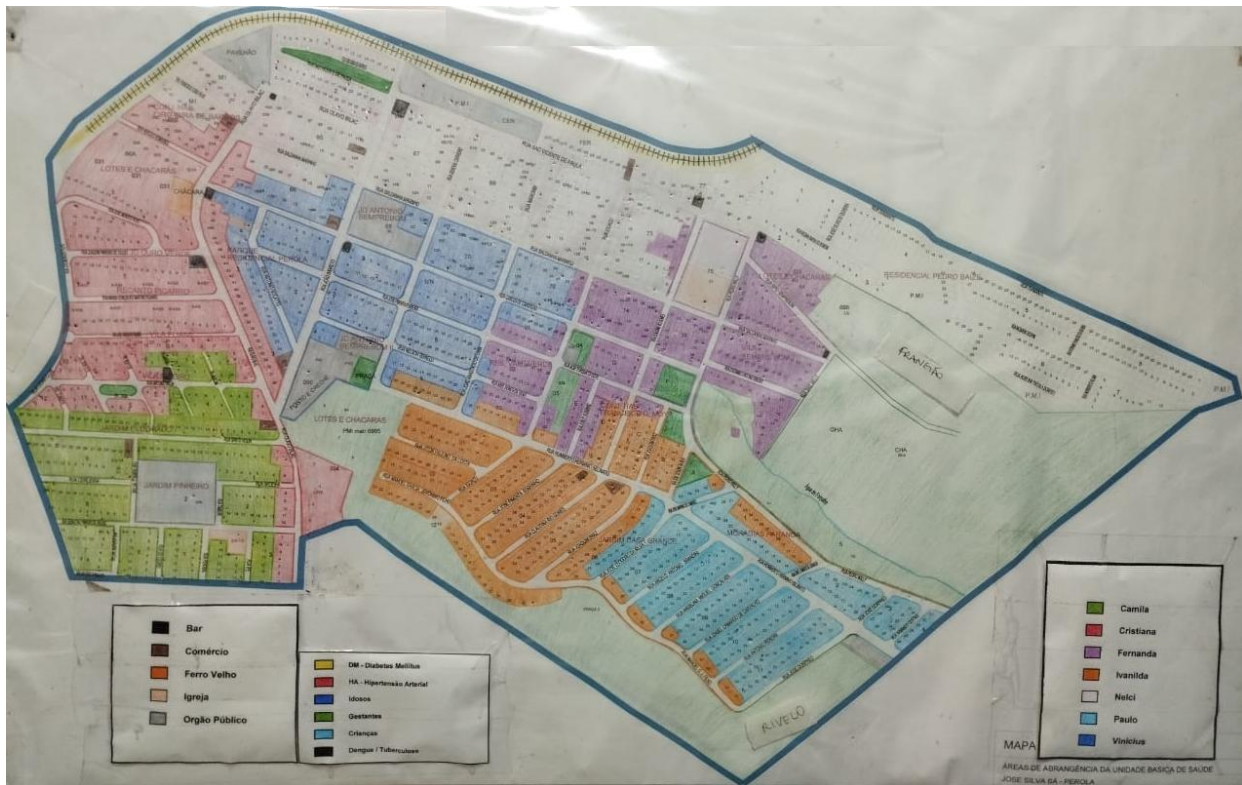
Figura 3. Mapa da área urbana: