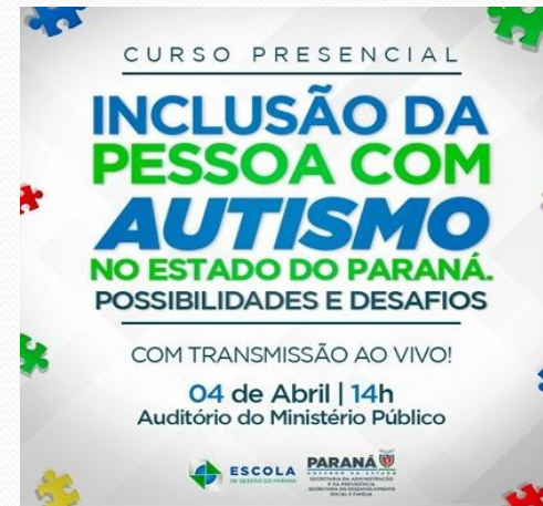
PROFISSIONAIS DO CAPSI PARTICIPARAM DESTA CURSO.