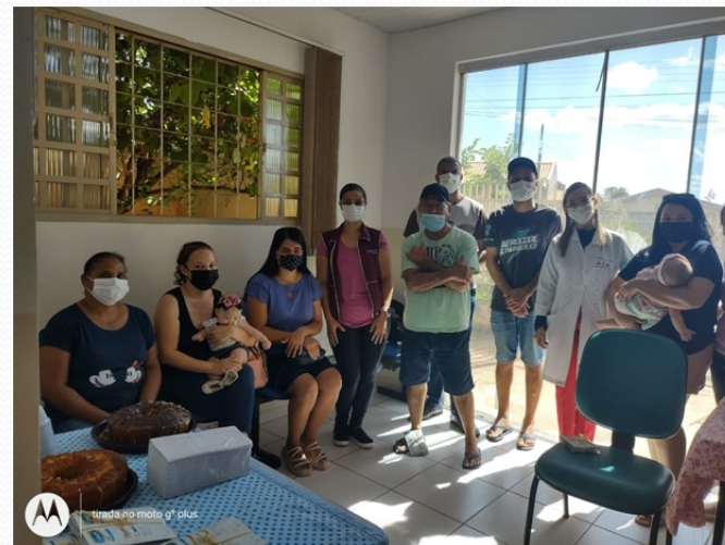
GRUPO DE DERMATITE ATÓPICA - REALIZADO PELA PEDIATRA DA UBS SERRAIA.