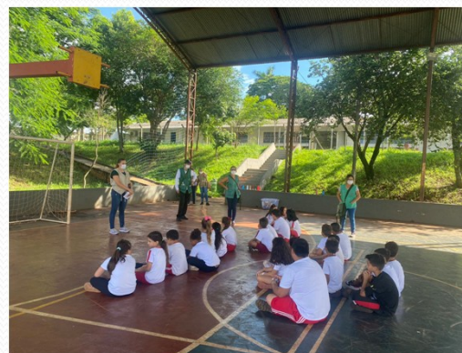
ORIENTAÇÃO DE DENGUE NOS CMEI E ESCOLAS.