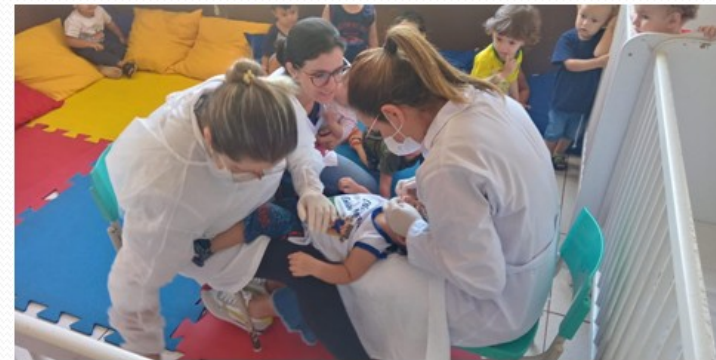
AÇÕES DO PSE: EQUIPE DE ODONTOLOGIA NOS CMEI.