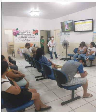
DIA DEDICADO AO ATENDIMENTO DA MULHER - 08 DE MARÇO.