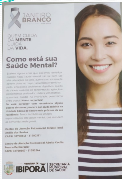
AÇÕES DE SAÚDE MENTAL - JANEIRO BRANCO.