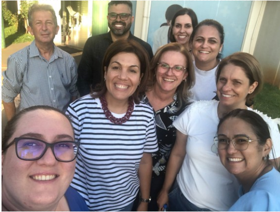
VISITA TÉCNICA AO MUNICÍPIO DE TOLEDO-PR: CONHECER SISTEMA DE SAÚDE.