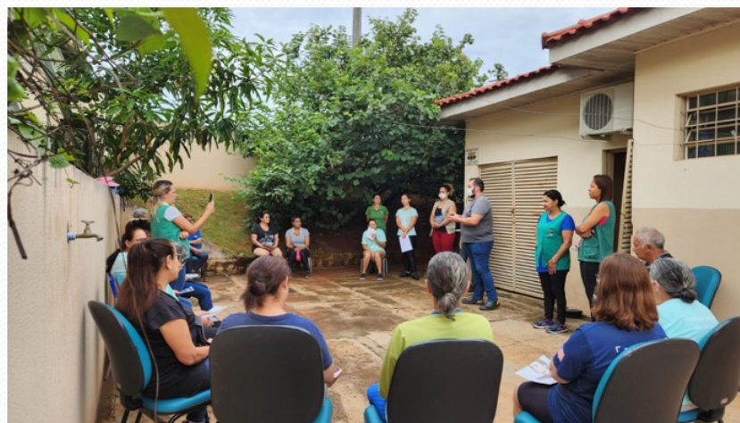
PALESTRA DE DENGUE E ALIMENTAÇÃO SAUDÁVEL NO GRUPO DE CAMINHADA.