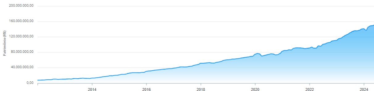
Evolução do Patrimônio

Destaca-se um crescimento contínuo e de boa curvatura evolutiva, não havendo períodos de retração ou declínio contínuo, havendo uma leve diminuição do patrimônio líquido ainda no primeiro trimestre de 2023, resultado esse devido ao péssimo desempenho do mercado financeiro.